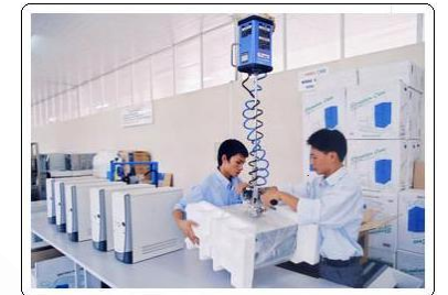
Đóng gói sản phẩm theo tiêu chuẩn