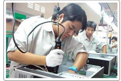
Lắp ráp trên dây truyền hiện đại