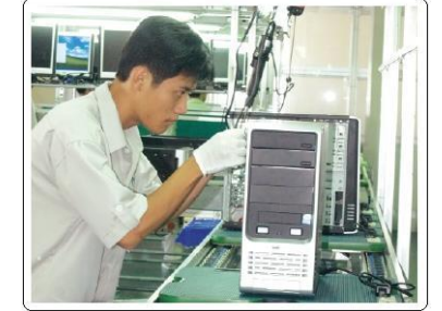
Toàn bộ sản phẩm được kiểm tra trước khi xuất xưởng